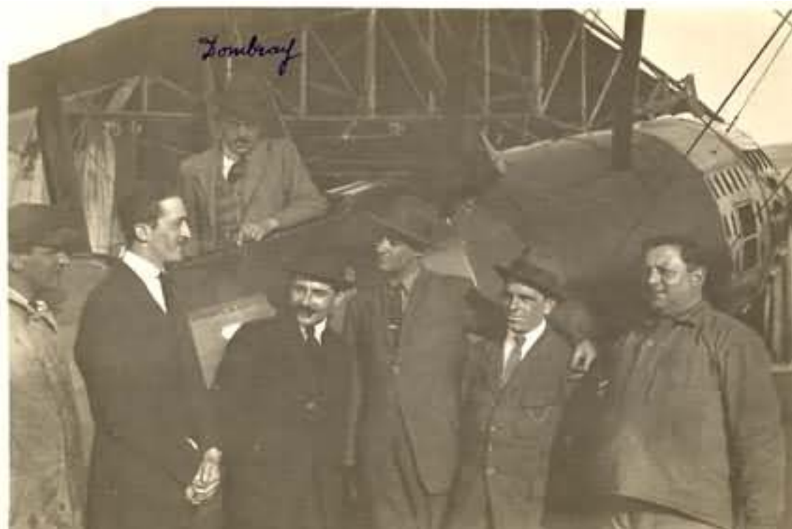
Beauté, Moine, Neuvy, Dewoitine, Koeffel