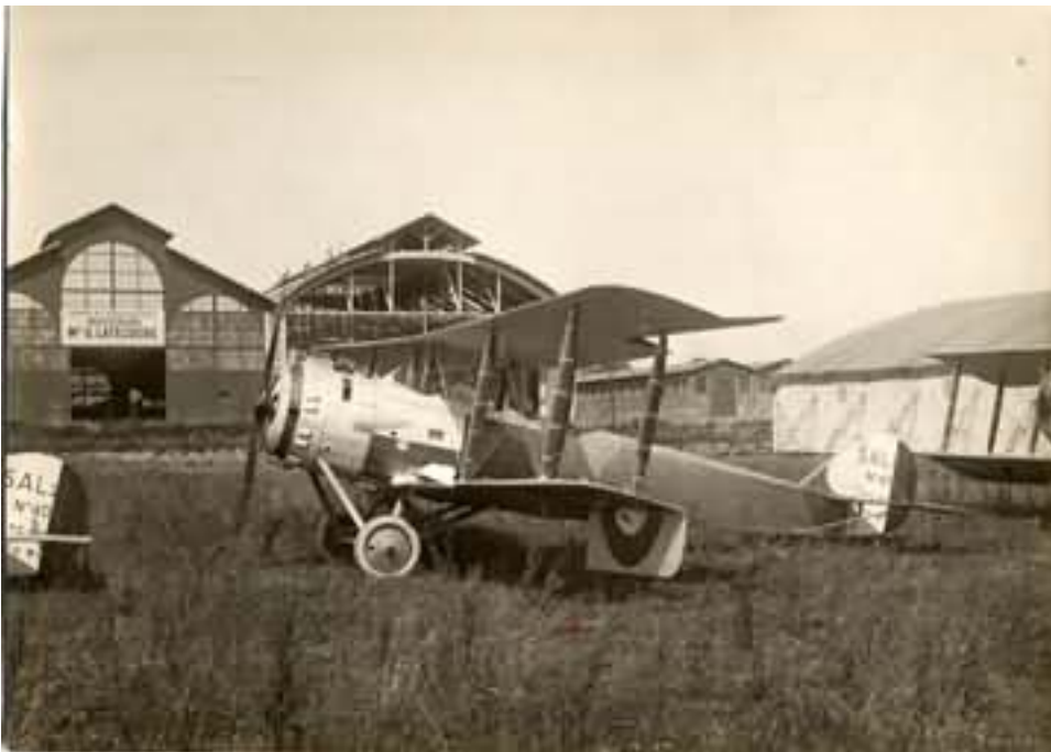
Maison Gabriel Latécoère