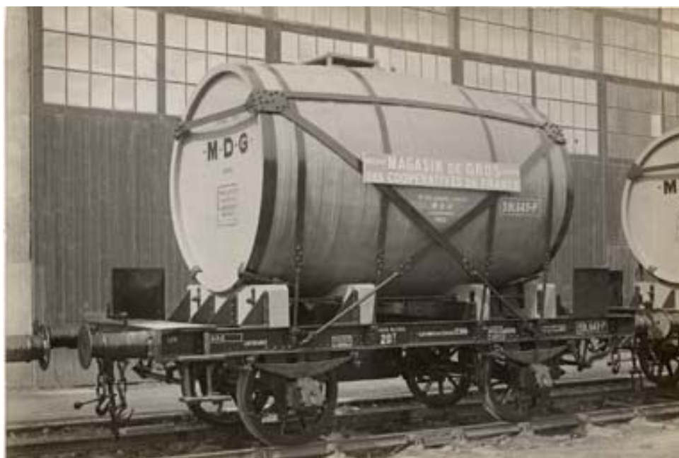
Les forges "Maison Pierre-Georges Latécoère"